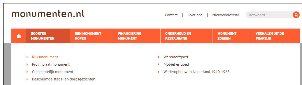
Figuur 1: Overzicht van soorten monumenten in Nederland, www.monumenten.nl